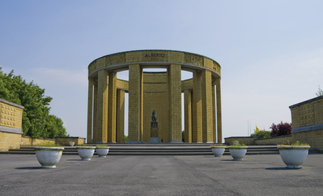
Monument Roi Albert Ier, Nieuwpoort