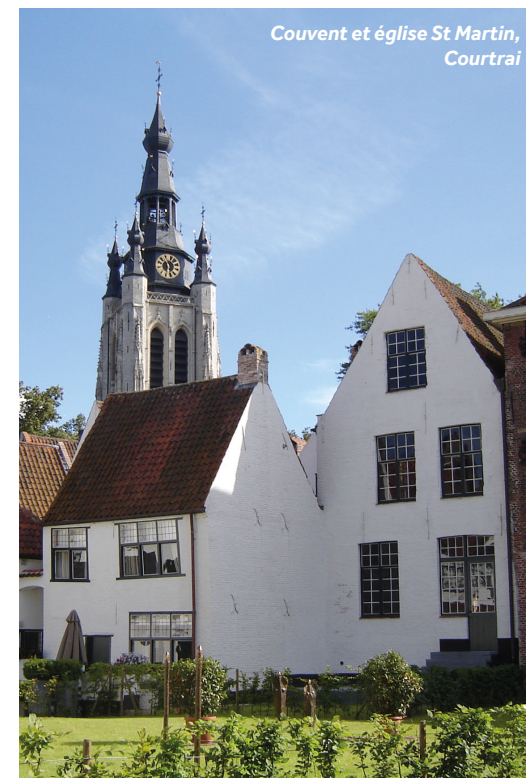
Couvent et église St Martin, Courtrai

Commerces : Vous trouverez des supermarchés et un vaste éventail de boutiques dans la grande zone commerçante.