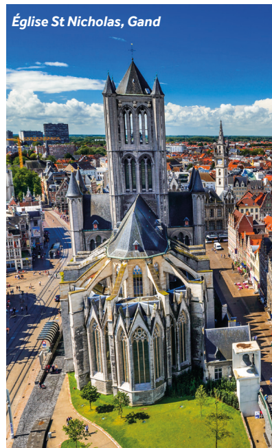
Église St Nicholas, Gand

Restaurant recommandé : Du Progress, dans le centre historique, sur Korenmarkt Commerces : magasins, restaurants et supermarchés que vous attendez d'une grande ville