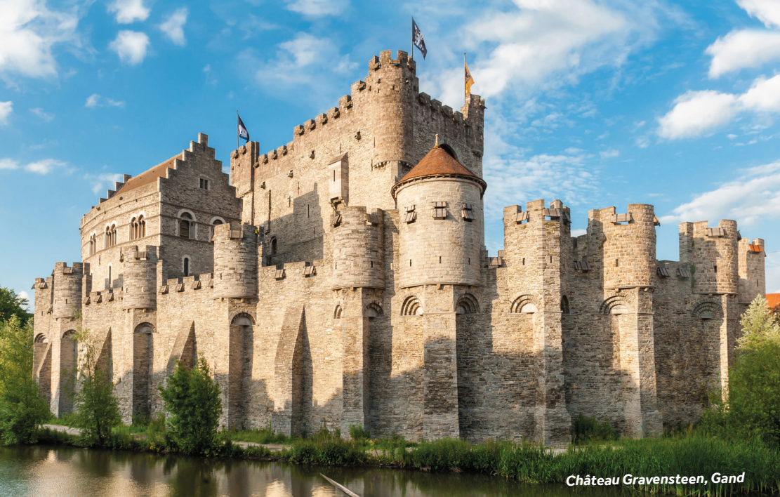
Château Gravensteen, Gand