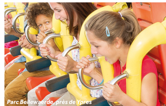
Parc Bellewaerde, près de Ypres

Ieper (plus connue sous son nom français, Ypres) est une jolie ville accueillante et pleine d'histoire. Comme dans la plupart des villes belges, la place du marché central est le carrefour d'activités, avec une magnifique architecture, des restaurants et des attractions, y compris les étonnantes Halles aux Draps (siège de l'excellent Musée Flanders Fields) et avec son beffroi de 70m. Descendez ensuite Menenstraat (à l'extérieur de la place) vers le Mémorial de la Porte de Menin, un lieu approprié pour se recueillir. Sous ses arches, à 20 heures précises le soir, vous pourrez entendre le 'last post', la sonnerie aux morts. Le son des clairons se fait entendre chaque jour depuis 1928, qu'il pleuve ou qu'il fasse soleil. Pour un peu plus de légèreté, les montagnes russes et les sensations fortes du parc Bellewaerde trouvent à 4,5 km à l'est de la ville.