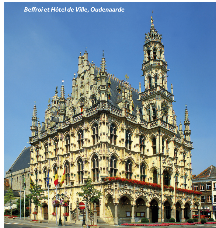
Beffroi et Hôtel de Ville, Oudenaarde

Restaurant recommandé : Brasserie Bruno, à Kalkhofstraat Commerces : de nombreux supermarchés et quelques restaurants