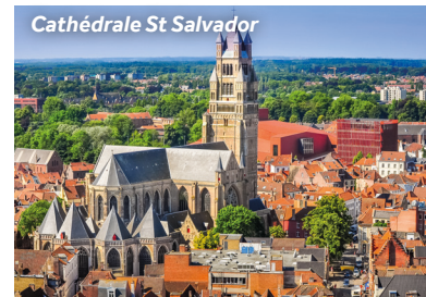
Cathédrale St Salvador

Restaurant recommandé : Reliva, juste au sud de la Cathédrale Saint-Sauveur sur Goezeputstraat