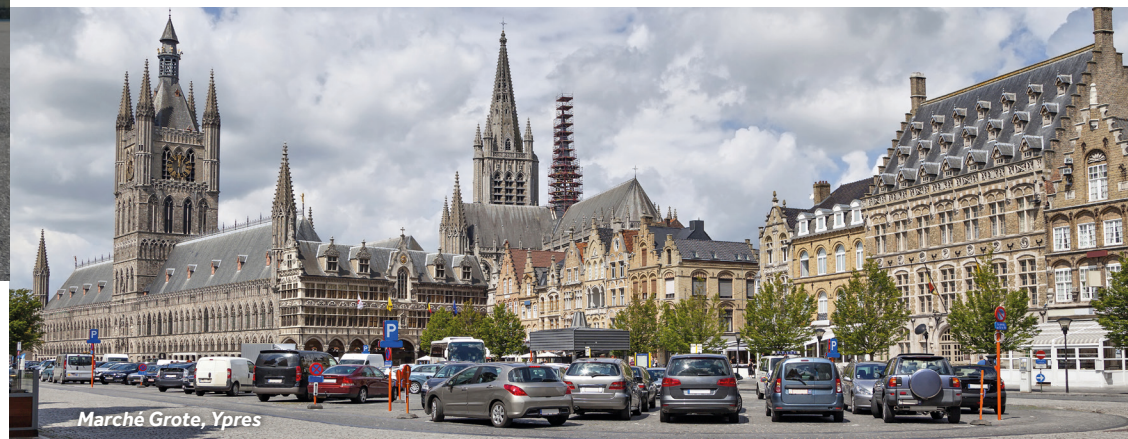
Marché Grote, Ypres