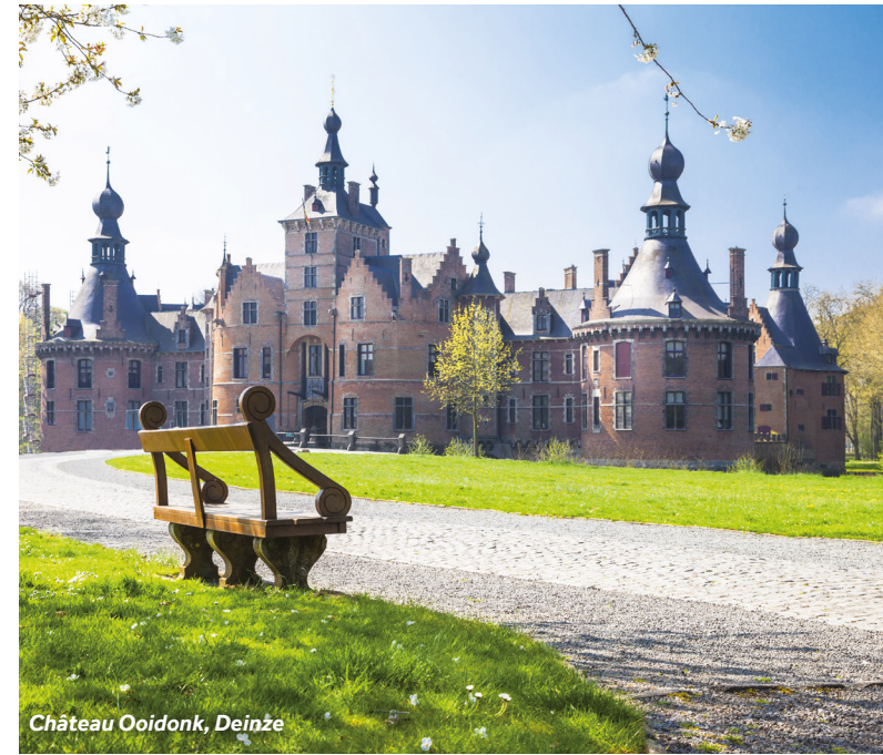
Château Ooidonk, Deinze

A 6 km au nord-est, se trouve l'élégant et majestueux Château Ooidonk, l'un des plus beaux d'Europe. Le château n'est ouvert que le dimanche et les jours fériés, mais les jardins sont ouverts du mardi après-midi au dimanche pour une promenade tranquille.