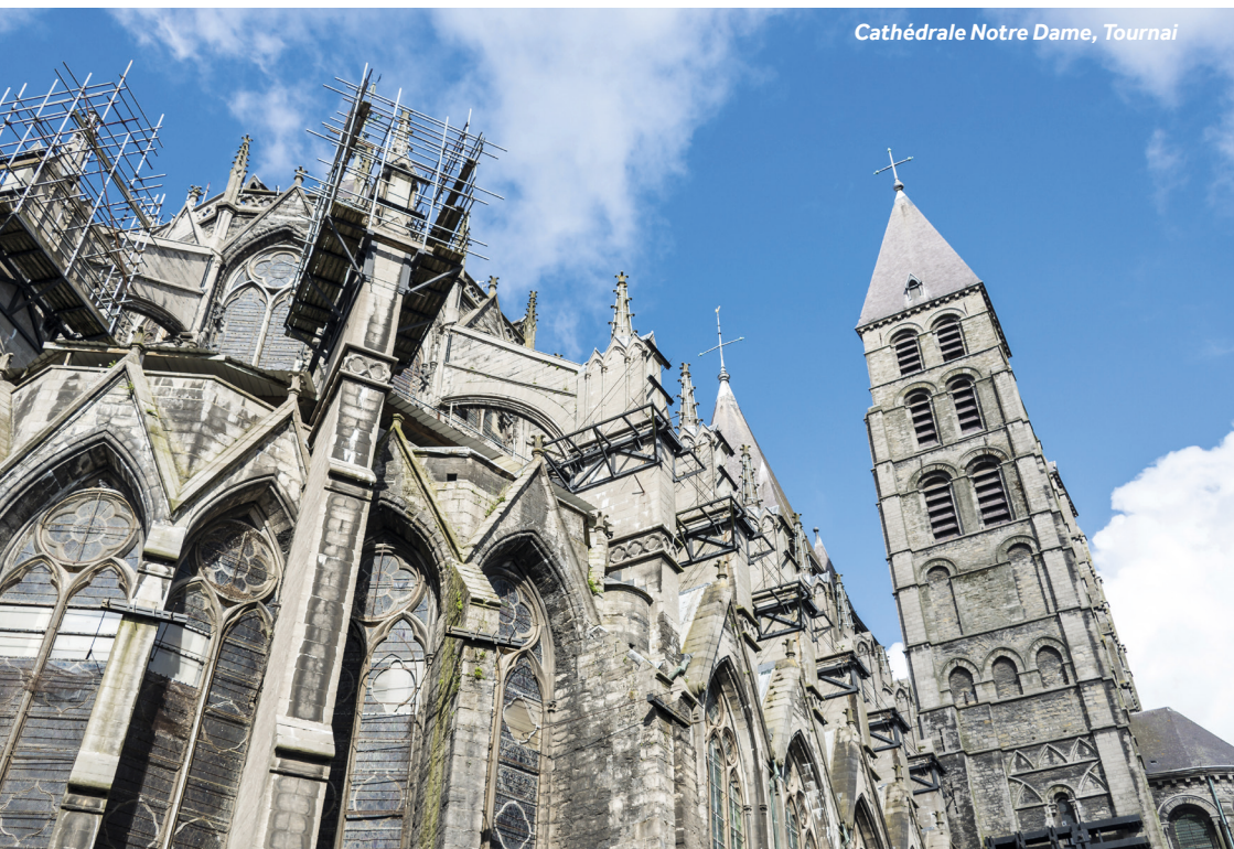
Cathédrale Notre Dame, Tournai

Commerces : De nombreux magasins et restaurants, ainsi qu'un supermarché à quelques pas au sud-est de la cathédrale