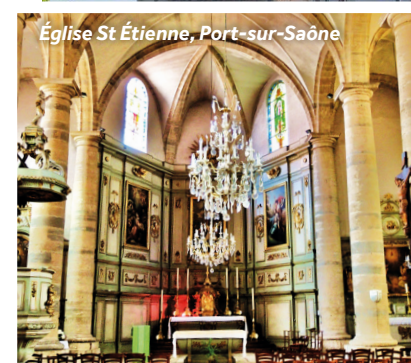
Église St Étienne, Port-sur-Saône