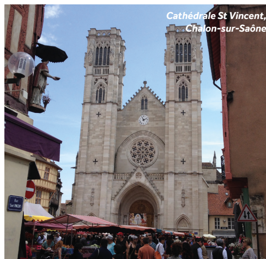
Cathédrale St Vincent, Chalon-sur-Saône