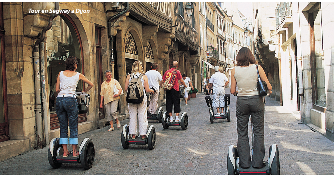
Tour en Segway à Dijon

Port : eau, électricité, sanitaires, douches, laverie, wifi.