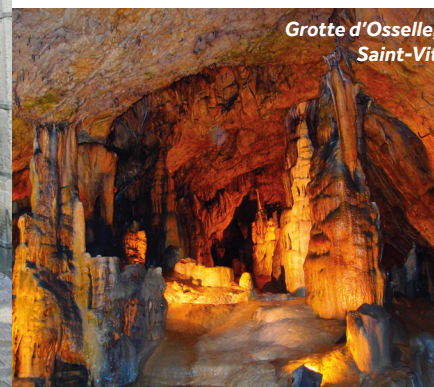
Grotte d'Osselle, Saint-Vit