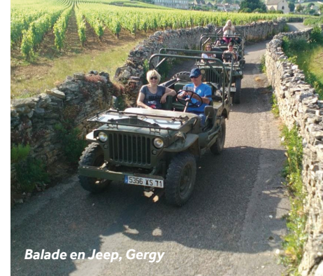
Balade en Jeep, Gergy

Commerces : épicerie, boulangerie, boucherie, café.