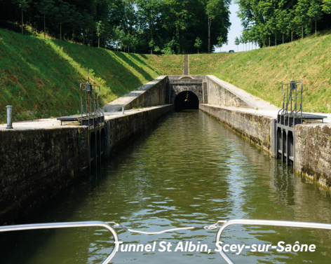
Tunnel St Albin, Scey-sur-Saône