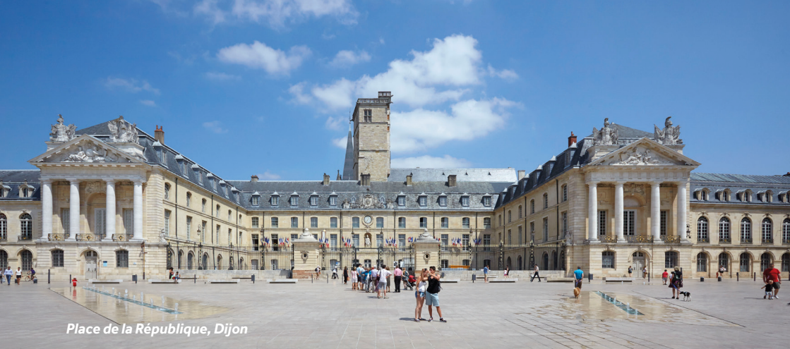
Place de la République, Dijon