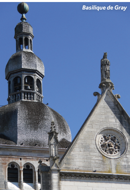
Basilique de Gray

Commerces : supermarché à 400m de l'amarrage près du Pont-Neuf, boulangeries, boucheries, cafés et restaurants.