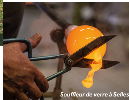
Souffleur de verre à Selles

Base Le Boat : eau, électricité, wifi, ainsi que douches et toilettes quand la base est ouverte.