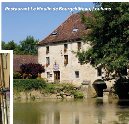
Restaurant Le Moulin de Bourgchâteau, Louhans