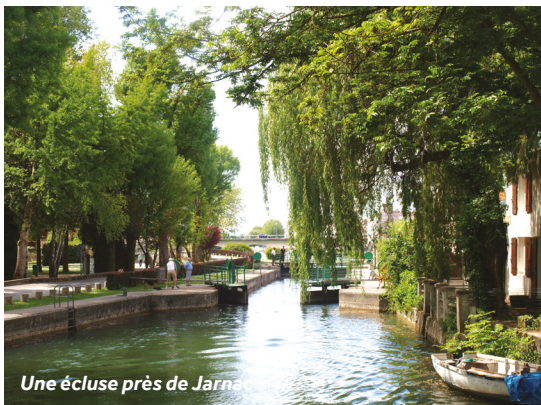
Une écluse près de Jarnac

Covered Marché : mardi à dimanche matin - rue Banvin.