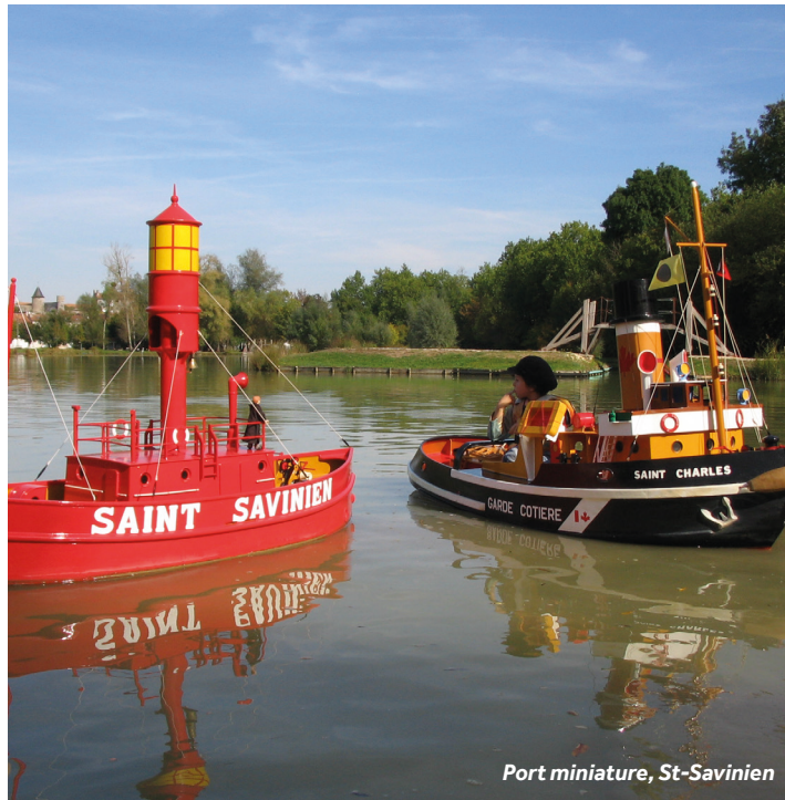
Port miniature, St-Savinien