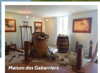
Maison des Gabarriers