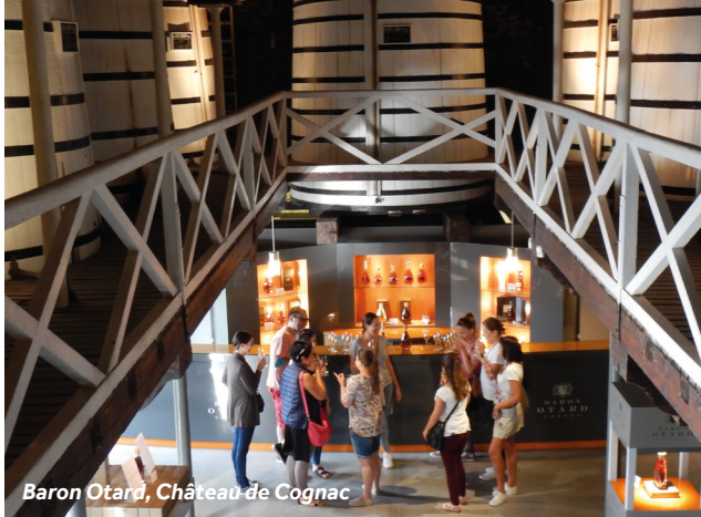
Baron Otard, Château de Cognac

Cognac est connue internationalement pour sa production de Cognac. Les façades et toitures recouvertes d'un léger velours noir en attestent - dû à un champignon résultant de l'évaporation de l'alcool. C'est ce que l'on nomme poétiquement « la part des anges ». Près du port, plusieurs grandes maisons de négoce proposent des visites et des dégustations. Nous vous conseillons la maison Baron Otard installée dans le château qui vit naître François Ier. Découvrez également les hôtels particuliers des marchands de sel, le couvent des Récollets magnifiquement rénové, et tout près, l'église du XIIe siècle avec sa façade romane percée d'une rosace flamboyante. Rendez-vous à l'Office de Tourisme pour découvrir les nombreuses façons d'explorer la ville. Ils disposent d'un livret de découverte intitulé "Laissez-vous conter Cognac" avec différents itinéraires, chacun avec son propre charme.