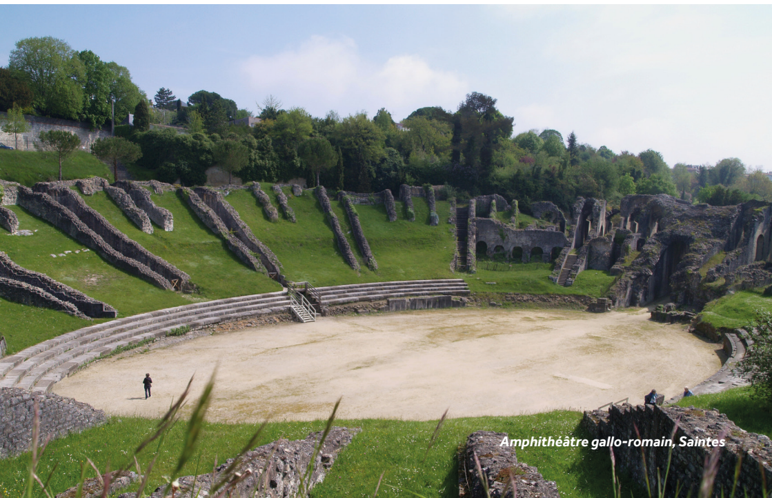
Amphithéâtre gallo-romain, Saintes

Commerces : boulangeries, boucheries, un supermarché, plusieurs cafés et de nombreux restaurants.