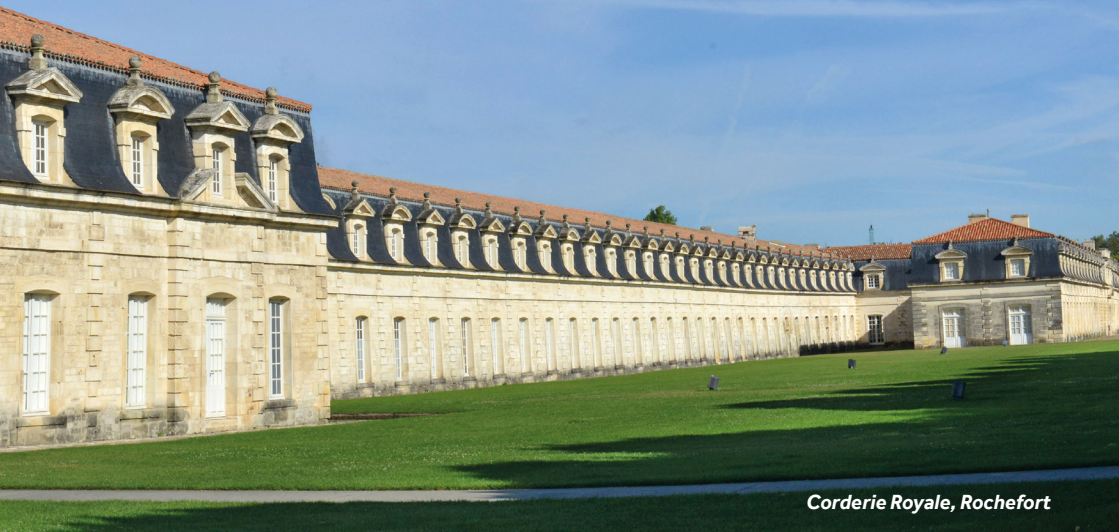
Corderie Royale, Rochefort