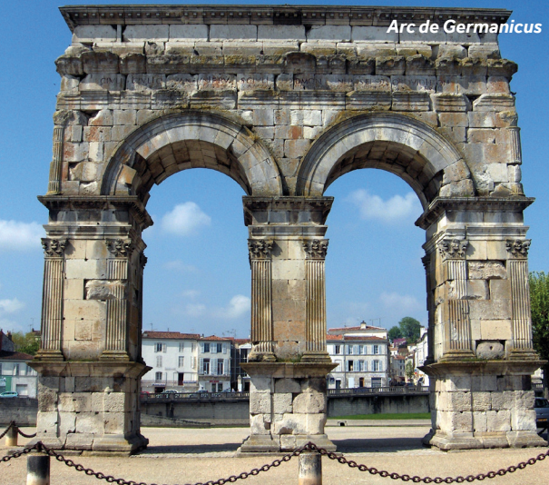
Arc de Germanicus