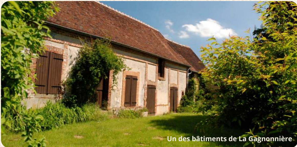
Un des bâtiments de La Gagnonnière